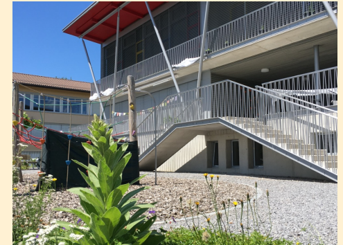
KG Lanzrain 1+2