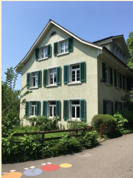
KG Altes Schulhaus 1+2